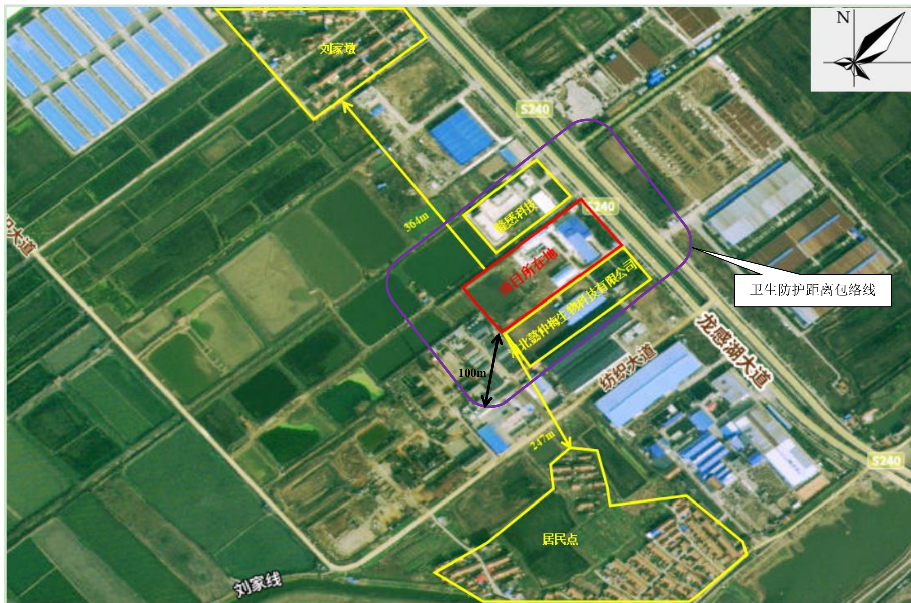
附图 5 项目卫生防护距离包络线图