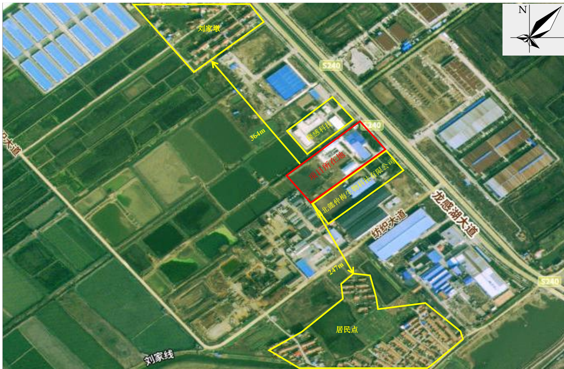
附图2 项目周边关系示意图